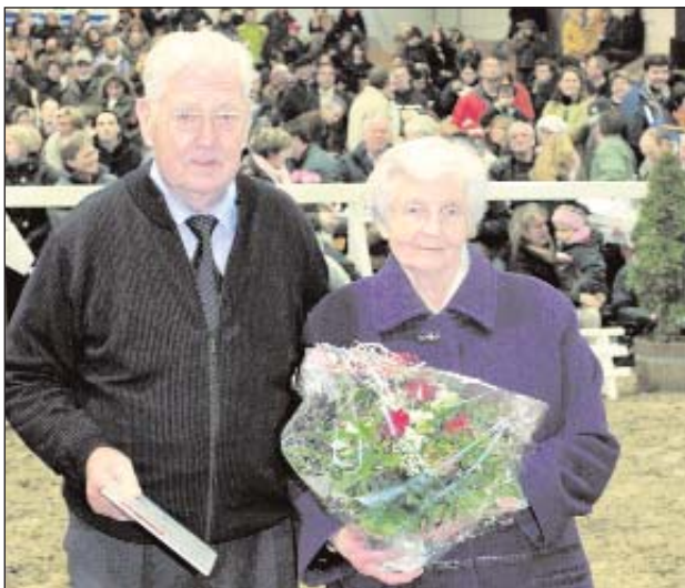
Das Züchterehepaar Liechti.