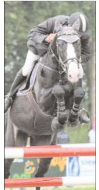
Der Sieger in Aktion.

sich das Dream-Team den Titel des CH-Pferdes 2007 mehr als verdient.